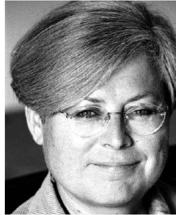
Herfkens

De vraag is nu of de huursuppletierегeling die Herfkens van het Nederlandse ministerie van Buitenlandse Zaken ontving gedurende de periode dat zij in New York woonde, hiermee in strijd is. Dat wordt nu naar aanleiding van een publicatie in het weekblad Vrij Nederland van deze week zowel in Washington als Den Haag onderzocht. In elk geval wist Herfkens' partijgenoot en uitvoerend UNDP-bestuurder Ad Melkert niet van de bijdrage in de huurkosten, die al onder zijn voorganger begon. „Ze heeft mij dat dinsdag pas meegedeeld”, zegt een